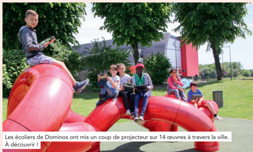
Les écoliers de Dominos ont mis un coup de projecteur sur 14 œuvres à travers la ville. À découvrir !

*Sur tablettes et smartphones, télécharger l'application « Guidigo » puis taper « Val-de-Reuil » (ne pas oublier les tirets). Simple et gratuit.