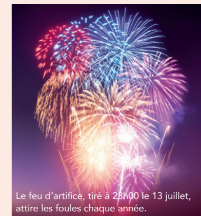
Le feu d'artifice, tiré à 23h00 le 13 juillet, attire les foules chaque année.

Et pour ceux qui souhaitent passer leur soirée au Parc Sud, le marché artisanal nocturne les accueillera dès 19h00,