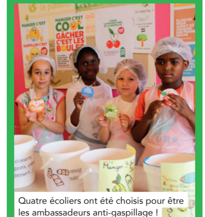
Quatre écoliers ont été choisis pour être les ambassadeurs anti-gaspillage !

Après avoir réorganisé le restaurant scolaire et le service, après avoir réévalué les quantités dans les assiettes, après de multiples ateliers de sensibilisation, le constat est éloquent : les restes se réduisent comme peau de chagrin dans les assiettes. Reste désormais à maintenir le cap sur le long terme à Louise Michel !