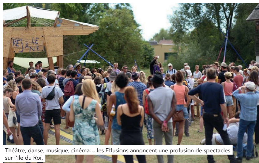
Théâtre, danse, musique, cinéma... les Effusions annoncent une profusion de spectacles sur l'Île du Roi.

*Samedi 2 septembre de 14h à 22h et dimanche 3 septembre de 12h à 18h sur l'Île du Roi. Entrée : 20 € pour tous les spectacles et les deux banquets. Rens sur www.valdereuil.fr