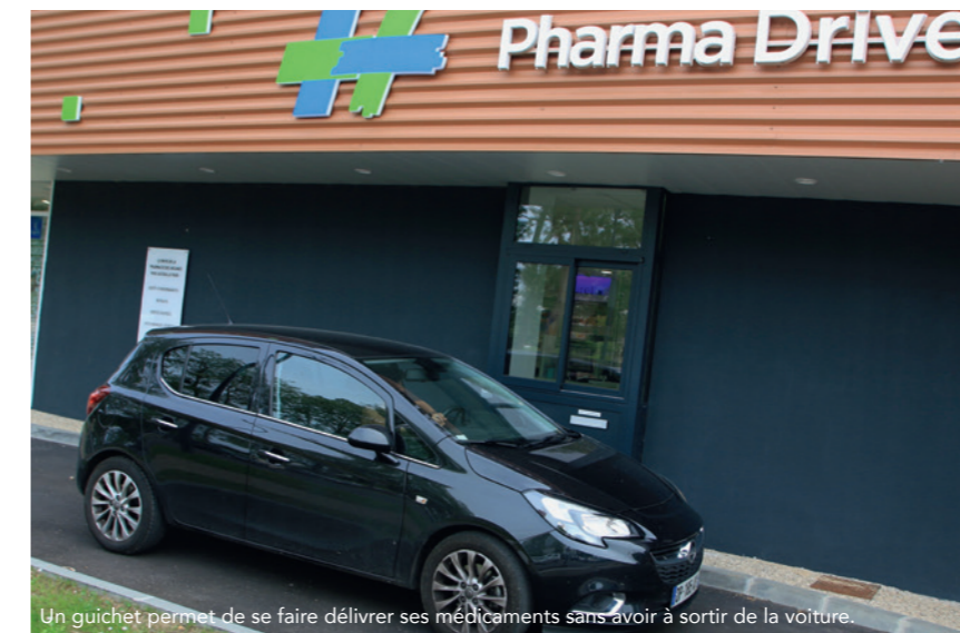
Un guichet permet de se faire délivrer ses médicaments sans avoir à sortir de la voiture.

Une première en Normandie ! Installé sur la route des Falaises, un pharmacien rolivalois se met à l'heure du « drive ». Un service innovant qui a rapidement trouvé son public.