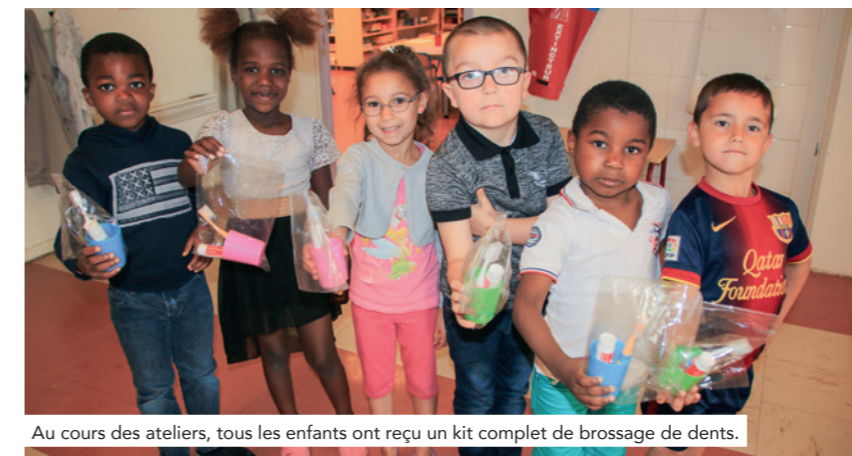
Au cours des ateliers, tous les enfants ont reçu un kit complet de brossage de dents.

à Val-de-Reuil, des familles, hélas trop nombreuses, ne donnent pas de suite concrète au courrier de l'assurance maladie proposant, à l'âge de 6 ans, un dépistage bucco-dentaire gratuit et, si besoin, la prise en charge des frais liés aux soins. Si bien qu'en arrivant en CP, les enseignants observent que certains enfants ont des dents cariées. Dès la rentrée de septembre, un suivi sera effectué auprès des enfants qui ont besoin de soins. Pour que tous les petits Rolivalois puissent avoir de belles dents !