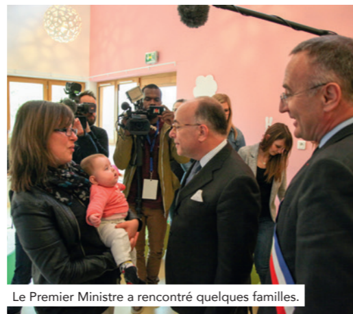
Le Premier Ministre a rencontré quelques familles.

l'écoquartier d'ailleurs qui avait été inauguré en début d'année par la ministre du Logement Emmanuelle Cosse. Ce jeudi soir de mai, le Premier Ministre (accompagné du porte-parole du gouvernement, Stéphane Le Foll) a donc visité les lieux, rencontré les familles et le personnel de la crèche avant de dévoiler la plaque qui trônera désormais dans le hall spacieux du nouvel équipement. Il n'a d'ailleurs pas caché son enthousiasme devant la qualité de cette crèche à la fois moderne et écologique.