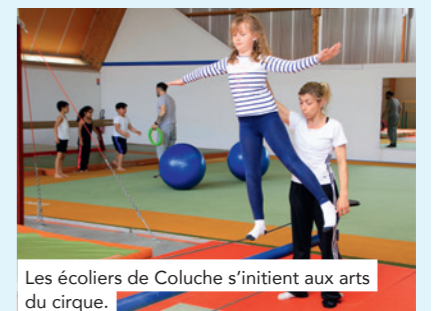
Les écoliers de Coluche s'initient aux arts du cirque.

Equilibro propose également, toute l'année, des ateliers et stages de perfectionnement aux arts du cirque pour jeunes adultes. Une présentation de leur travail aura lieu le mercredi 28 juin au théâtre de l'Arsenal.